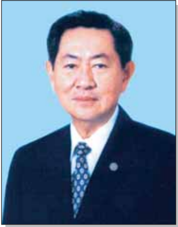
ดร.อำนวยการ วิรวรรณ ประธานกรรมการ

Dr. Amnuay Viravan Chairman of the Board of Directors